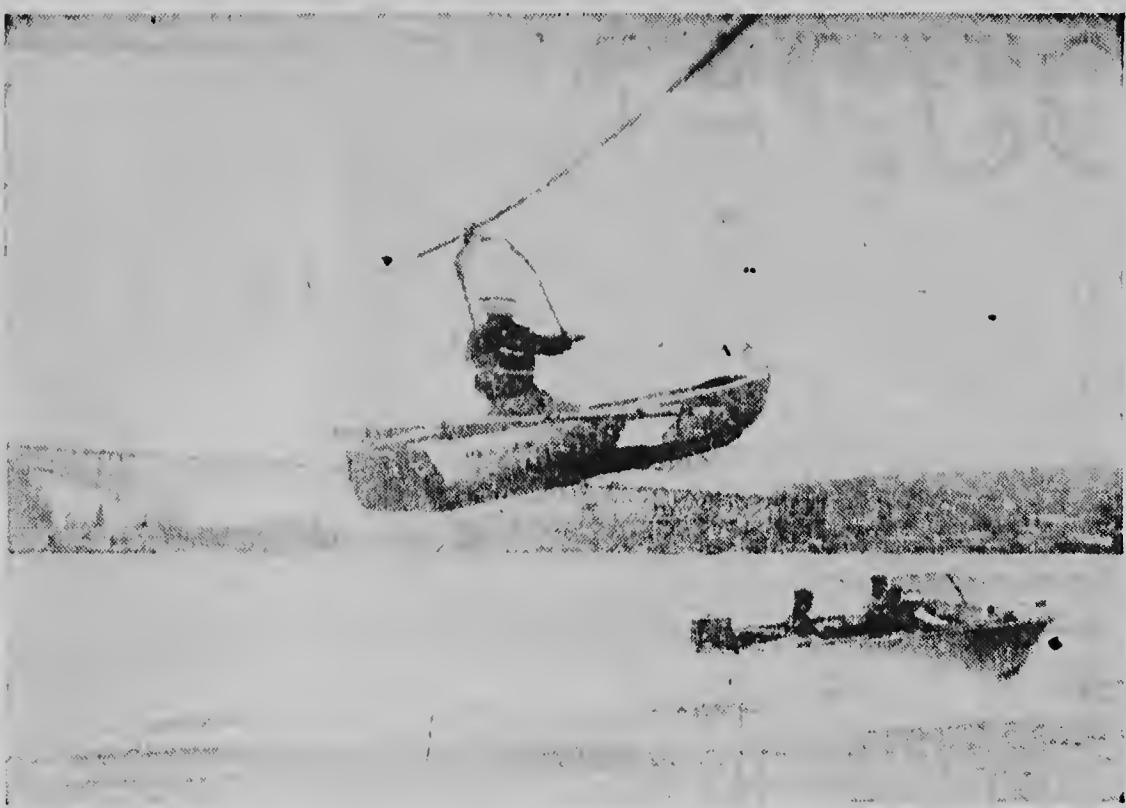
John Spach ta purba su aparatonan pa touw na Seattle, Washington. Propellernan move pa aire similar na di un helicopter ta lamta e boto di aluminiu 12 pia ora cu e towboat alcanza 25 mph. Lar-gura di e cabuya y e speed ta determina con haltu Spach por rema.